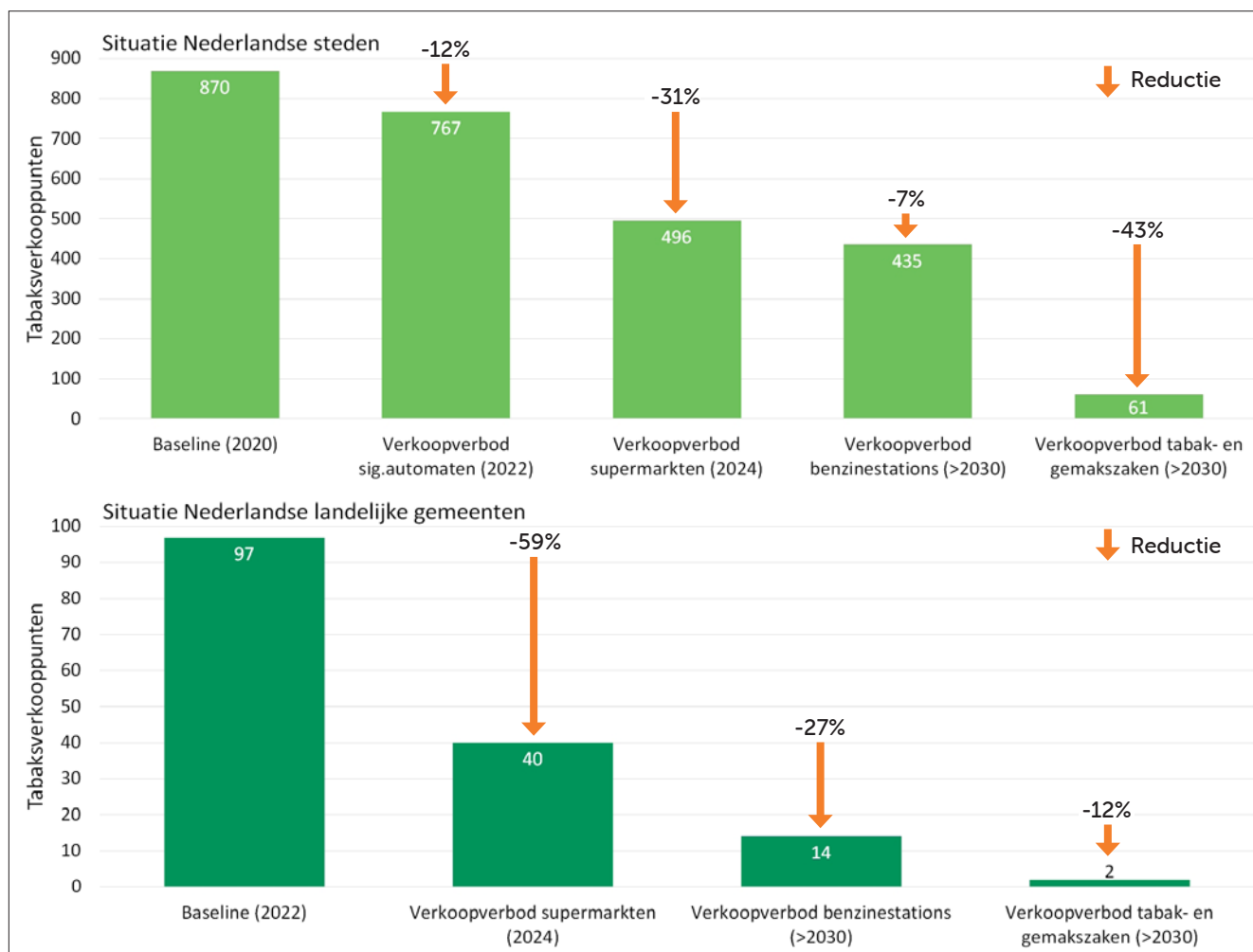
Figuur 3. Verwachte afname aantal tabaksverkooppunten in Nederlandse steden en landelijke gemeenten na invoering van verkoopverboden voor diverse winkeltypen.